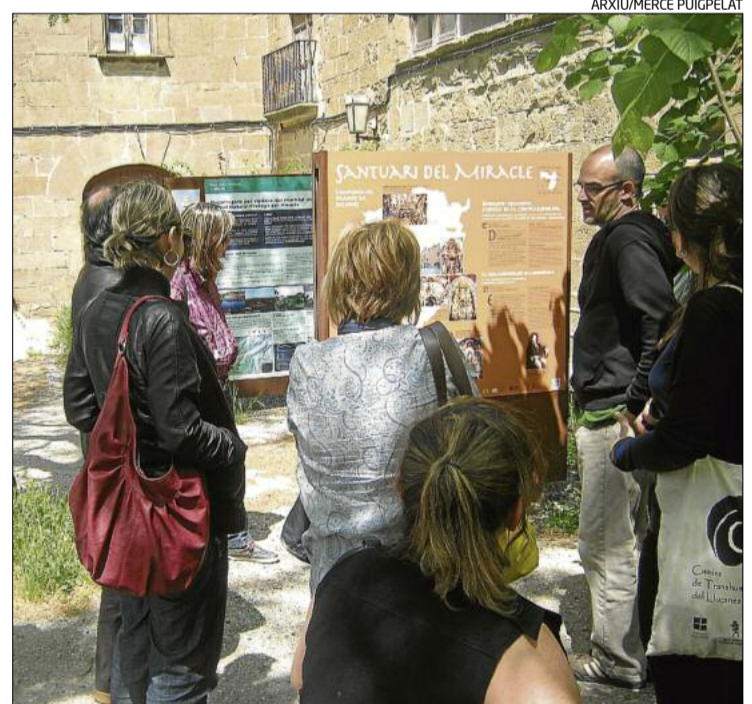
Visita al Miracle en una de les activitats de Territori de Masies

brarà el plenari general del projecte Actua. El 2009 es va iniciar un procés popular en què els veïns i entitats de la comarca van decidir actuacions per dur a terme als pobles i van començar a treballar-hi. Aquest procés, anomenat projecte Actua, ha executat, d'alesho-